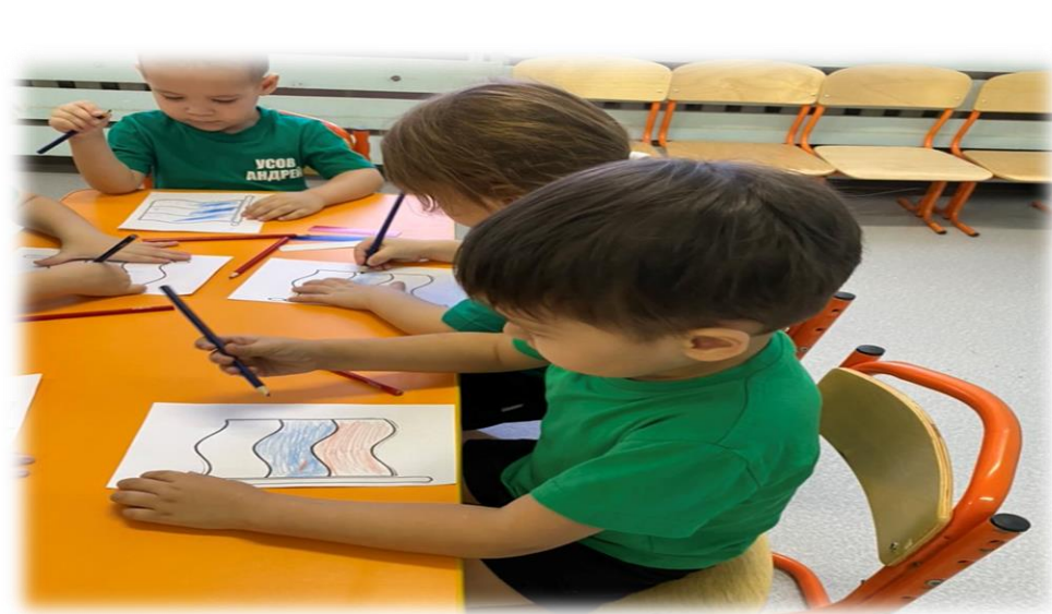
Разукрашивание флага России цветными карандашами